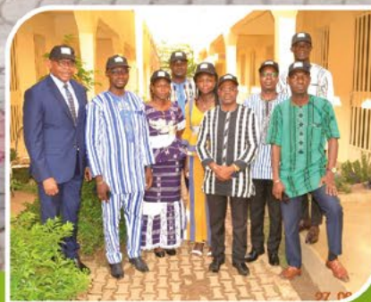
P4 La GA-VIE en retraite stratégique