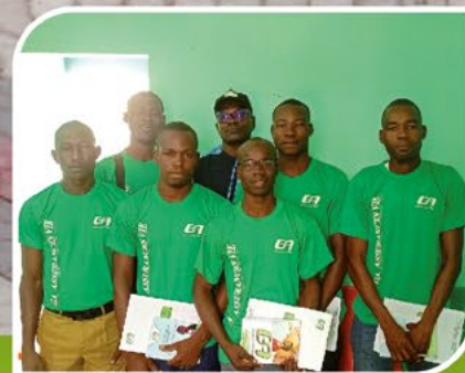
P5 Installation d'une équipe commerciale à la agence GA Gaoua